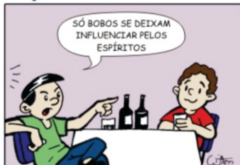
53 - Sem noção