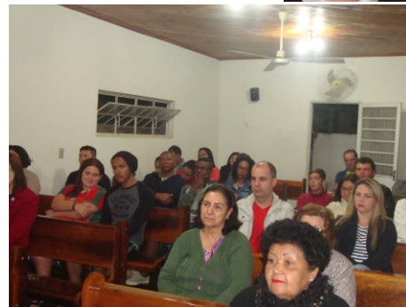
Público presente no "Amor e Caridade"