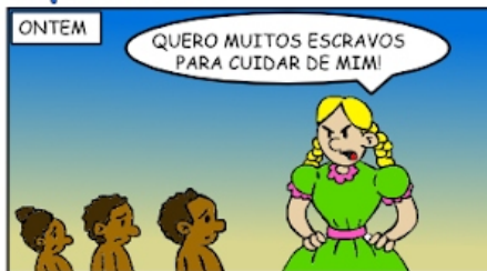
87 - PROFESSORA