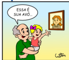
151 - ABRAÇO