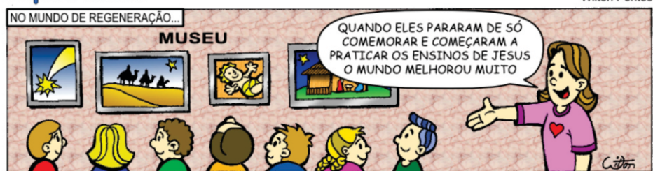
89 - TRANSIÇÃO - NATAL