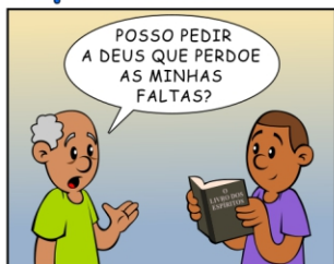
384 - L.E.* RESPONDE: PRECE