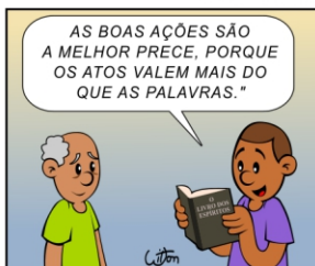
*O Livro dos Espíritos, pergunta nº 661